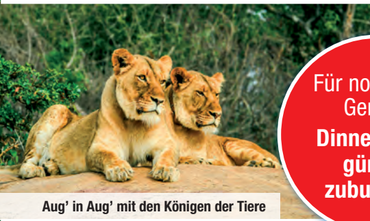
Aug' in Aug' mit den Königen der Tiere

Für noch mehr Genuss: Dinner-Paket günstig zubuchbar!