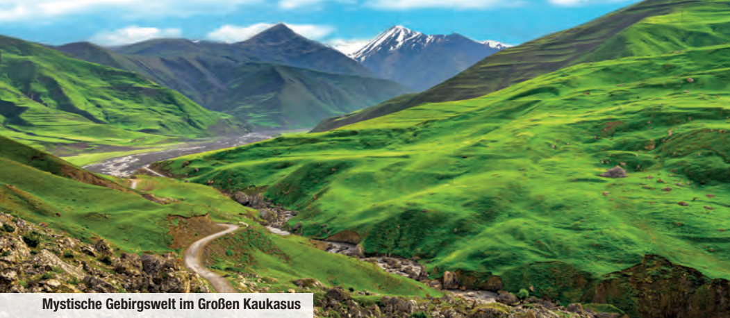
Mystische Gebirgswelt im Großen Kaukasus