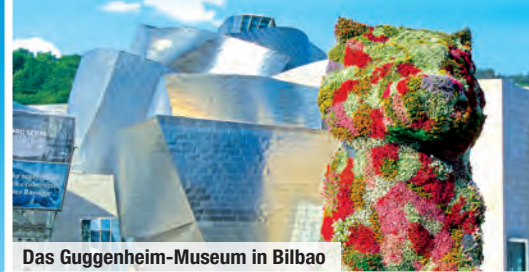
Das Guggenheim-Museum in Bilbao

Inklusive • Komplettes Ausflugsprogramm • Erlebnis-Genusspaket • 4-Sterne-Hotels