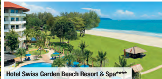
Hotel Swiss Garden Beach Resort & Spa****