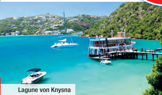
Lagune von Knysna

Für noch mehr Genuss: Dinner-Paket günstig zubuchbar!