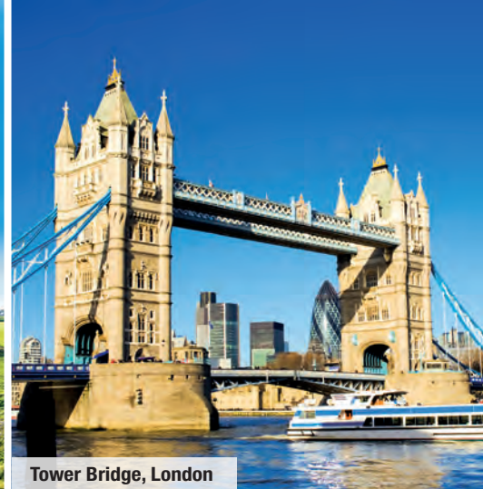
Tower Bridge, London