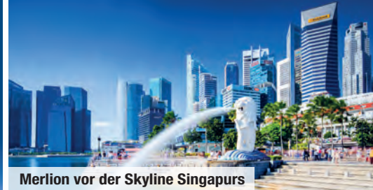
Merlion vor der Skyline Singapurs