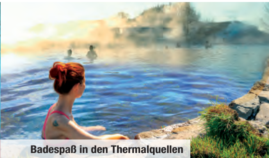
Badespaß in den Thermalquellen