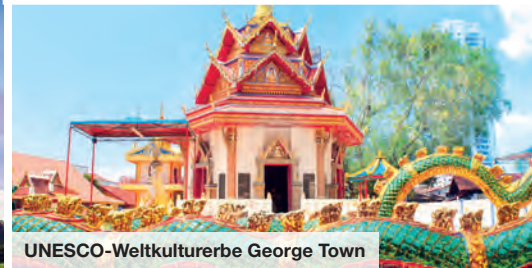
UNESCO-Weltkulturerbe George Town