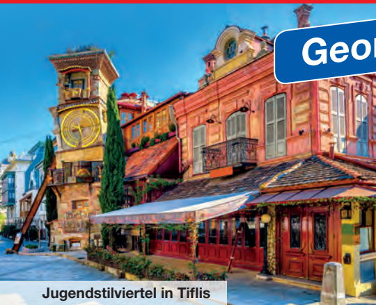
Jugendstilviertel in Tiflis