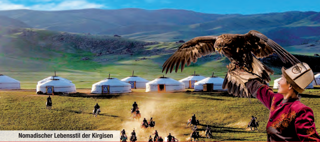
Nomadischer Lebensstil der Kirgisen

Erleben Sie Zentralasien in der Kleingruppe intensiv und in bester Gesellschaft