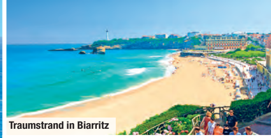
Traumstrand in Biarritz