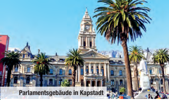
Parlamentsgebäude in Kapstadt