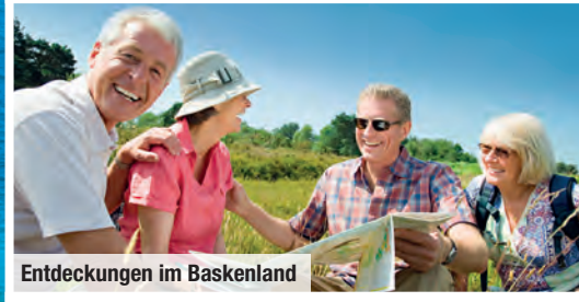
Entdeckungen im Baskenland

Genießen Sie Kultur und Kulinarik des Baskenlandes in der Kleingruppe!