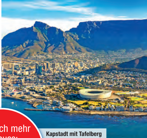
Kapstadt mit Tafelberg