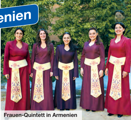
Frauen-Quintett in Armenien

Erleben Sie die einzigartige Natur und Kultur des Kaukasus in der Kleingruppe!