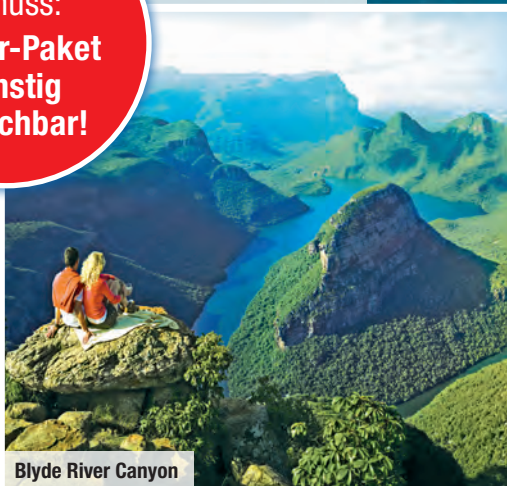
Blyde River Canyon